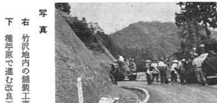
右 竹沢地内の舗装工事

この開発の中心である道... 本年は中野・寺野間完成へ。県道改良工事、本年は中野・寺野間完成へ。県道改良工事、本年は中野・寺野間完成へ。