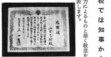
本年の納税成績は、納税率は九十九パーセントに達しました。

本年の納税成績は、納税率は九十九パーセントに達しました。県民税では知事から褒賞を授けられました。