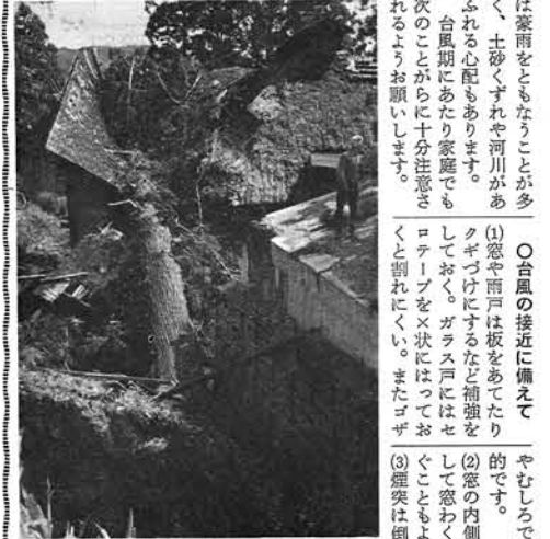
第2室戸台風による被害

これからの十月にかけては、台風シーズンです。近年の大きな災害をもたらした台風は九月中頃から下旬にかけて数多く襲ってきています。最近の例として、