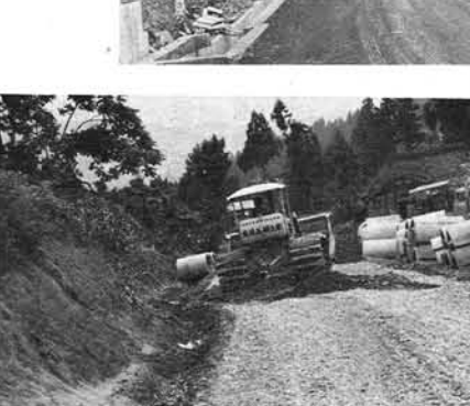
下 種学原で進む改良工事