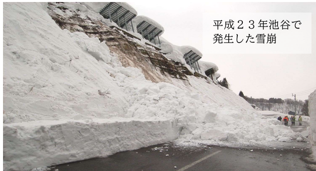
平成23年池谷で発生した雪崩