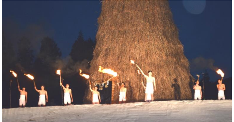
▲昨年の点火式の様子

ご理解とご協力を、よろしくお願ひします。 ※イベント内容は、天候により、時間が変更、又は中止になる場合があります。