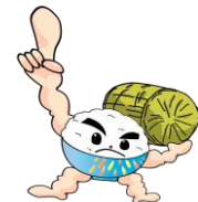
長岡うまい米キャラクター —「まんまくん」