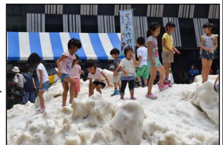
▲昨年のやまこしフェアの様子

当日は、9:40に支所前から会場行きの無料クローバーバスを運行しますのでご利用ください。