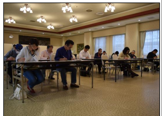
▲昨年のやまこし検定の様子