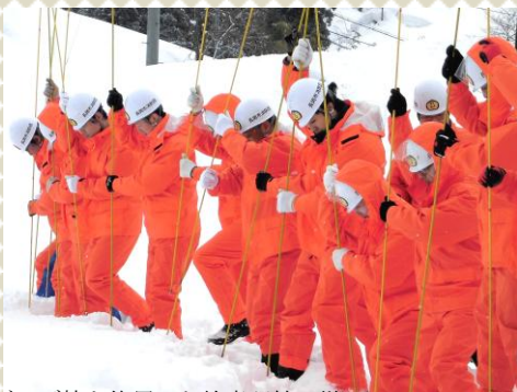
ゾンデ棒を使用した検索訓練の様子