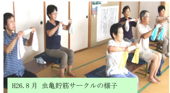
H26. 8月 虫亀貯筋サークルの様子

交互に足を出せるようになったと思ったら、今では足取りも軽く、2階に物を取りに行くのもおっくうではありません。