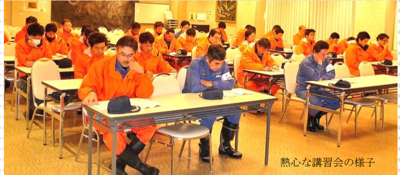
熱心な講習会の様子