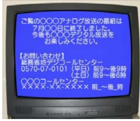
7月24日正午から深夜まで