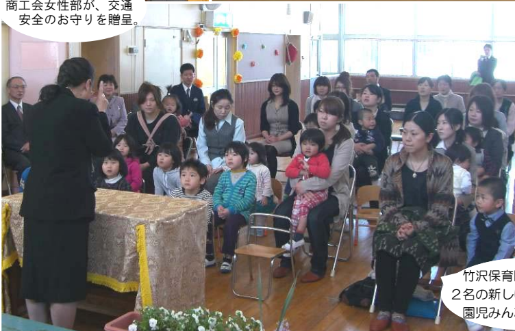
竹沢保育園入園式(4/5) 2名の新しいお友達が入園。 園児みんなて歌を披露。