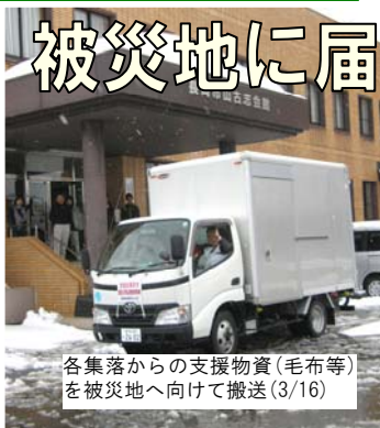
各集落からの支援物資(毛布等)を被災地へ向けて搬送(3/16)