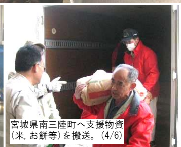
宮城県南三陸町へ支援物資(米、お餅等)を搬送。(4/6)