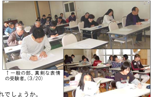
↑一般の部、真剣な表情の受験者。(3/20)