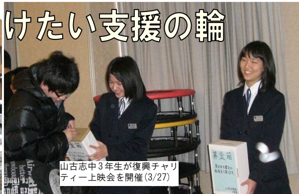
山古志中3年生が復興チャリティー上映会を開催(3/27)