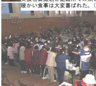
支援物資搬送と避難所での炊き出し。(宮城県南三陸町) 暖かい食事は大変喜ばれた。(3/20)

中越大震災でいただいた支援に、感謝の思いを込めて、 地域住民による復興支援が始まっています