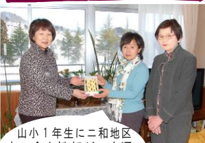
山小1年生に二和地区 商工会女性部が、交通 安全のお守りを贈呈。