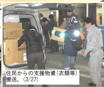
住民からの支援物資(衣類等)搬送。(3/27)