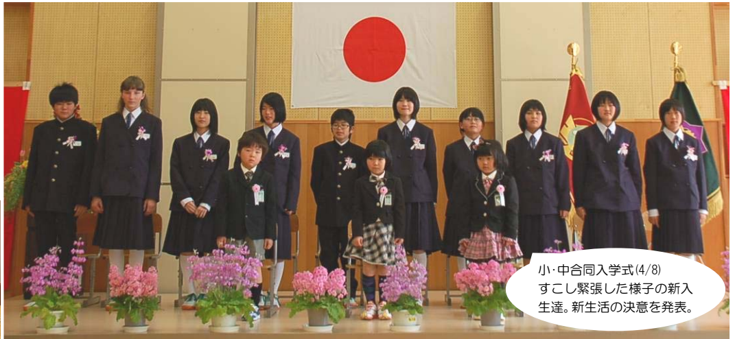
小・中合同入学式(4/8) すこし緊張した様子の新入 生達。新生活の決意を発表。