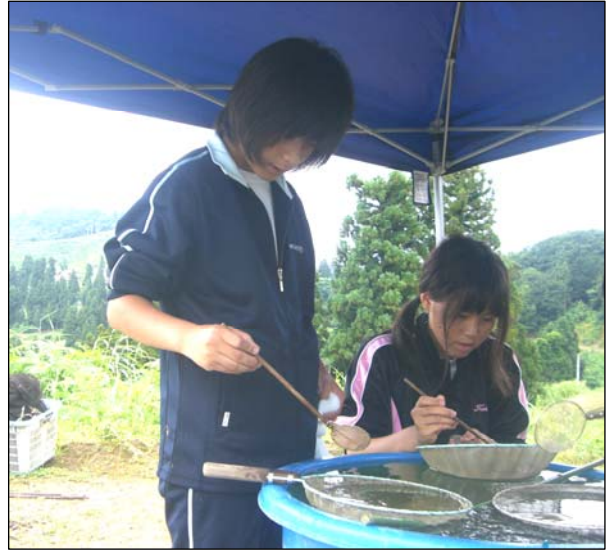
↑江戸川区立二之江中の生徒が山古志地域で民泊。鯉の選別など、民泊農家で田舎暮らしを体験。 (7/29.30.31)

→山古志地域成人式。新成人17名が、震災後に新築した小中学校の校舎を見学。(8/14)