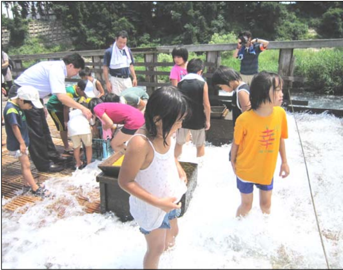
↑青空ぼうけん塾の体験泊。 川口やなで涼しい夏を満喫。 (8/7.8)