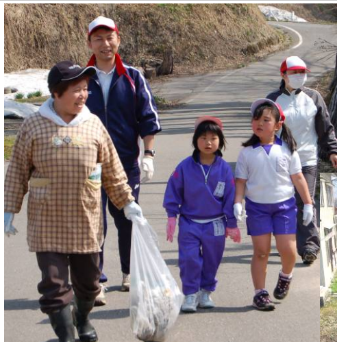
山古志老人クラブと山古志小中学校が合同でクリーン作戦。道路沿いなどのごみを約140kg集めました。(5月6日)