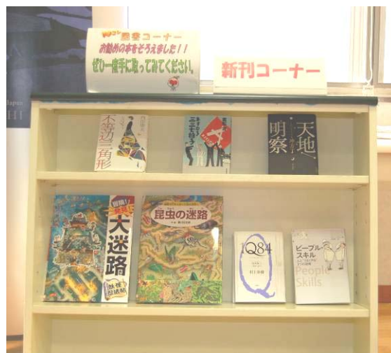
図書ラウンジ入り口の新刊コーナー