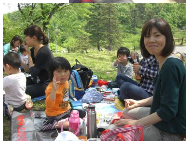
竹沢保育園が悠久山公園へ親子バス遠足。元気いっぱい遊んだあとはおいしいお弁当をモグモグ。(5月18日)