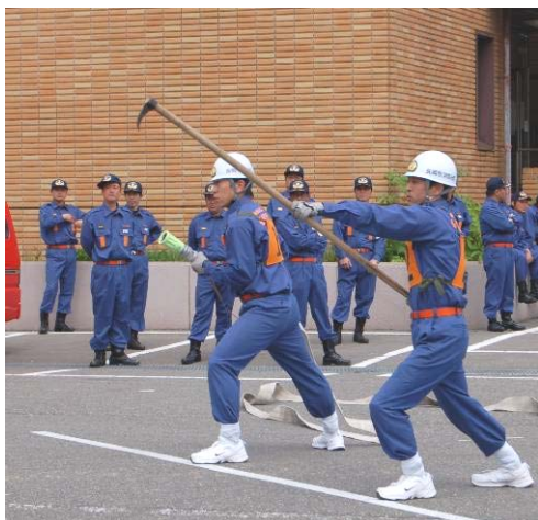
山古志方面隊消防演習で各分団がポンプ操法や放水訓練など日ごろの訓練の成果を披露しました。(5月16日)