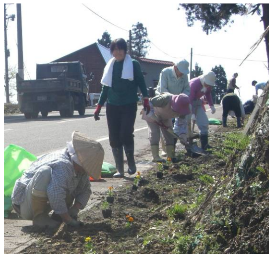
山古志地域の各所で花植え。地域全体で約4,200本の花苗を花壇や道路沿線に植えました。(5月8日～)