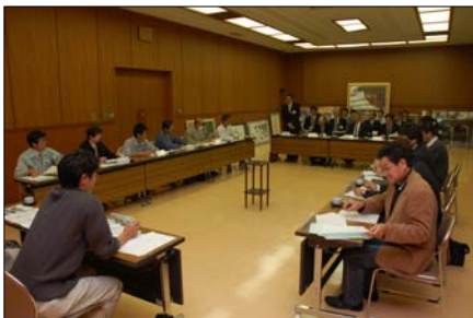
第4回の委員会の様子

また、前回の委員会で設置された教育分科会の経過報告及び先日開催された長岡市震災対策訓練について報告がありました。