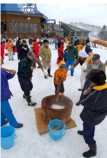
↑ ①復活！古志高原スキー場スキーカーニバル 4シーズンぶりのスキーカーニバル。ふるまいやお楽しみ抽選会、無料スキー教室に雪上花火と盛りだくさんの内容でした。

元旦の古志高原スキー場再開で始まった2008年。仮設住宅を退去し、ふるさと山古志へ戻った今年は、古志の火まつりをはじめ多くの事業や集落の行事が再開されました。そんな2008年をふり返ってみましょう。