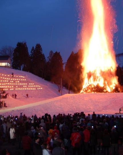
← ②復活！古志の火まつり 4年ぶりに「古志の火まつり」が復活。高さ25mの巨大さの神が天高く燃え上がり、これからの復興を誓いました。