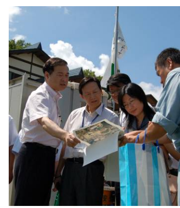
← ⑥中国四川省震災復興視察団視察 仇団長以下約40名が、四川大地震中山間地の復興の参考にとしようと天空の郷や公営住宅竹沢団地を視察。