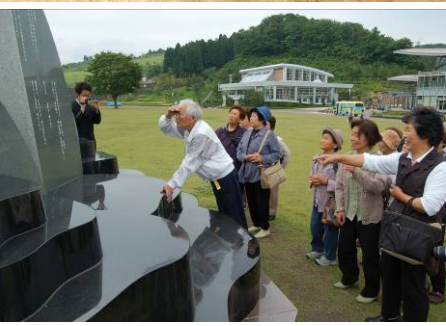
→ ⑤思い出の陽光台へ 仮設住宅退去から半年。3年暮らした陽光台仮設住宅跡地や国営丘陵公園をまわりました。