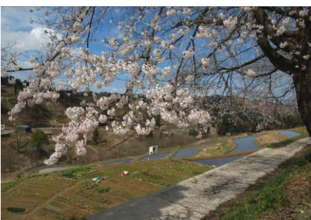
↑ 山古志も桜満開（4月） 竹沢公営住宅にある古い桜の木々。今年も棚田を見下ろすようにたくさんキレイな花を咲かせました。