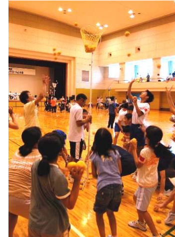
↑ ⑦山古志地域総合レクリエーション大会 4年ぶりとなる分館対抗のレクリエーション大会。玉入れやスリッパ飛ばし、胴つきりレーなど熱戦が繰り広げられました。結果竹沢分館が優勝