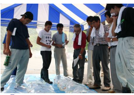
↑ ⑨秋の錦鯉新作鑑賞会 震災後初となる錦鯉養殖組合等による新作鑑賞会が開催され、買い付け等に多くの方が訪れました。