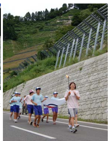
↑ ⑧炬火採火式 2009年に開催される新潟国体。その炬火採火式が山古志闘牛場で開催。採火記念りレーでは中村真衣さんや子どもたちでリレー。