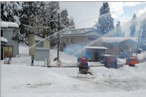
←山古志方面隊出初式 山古志会館で長岡市消防団山古志方面隊の出初式が行われました。その後、各分団で放水訓練などが実施され、この一年の地域を守る誓いを新たにしました。(1月4日)