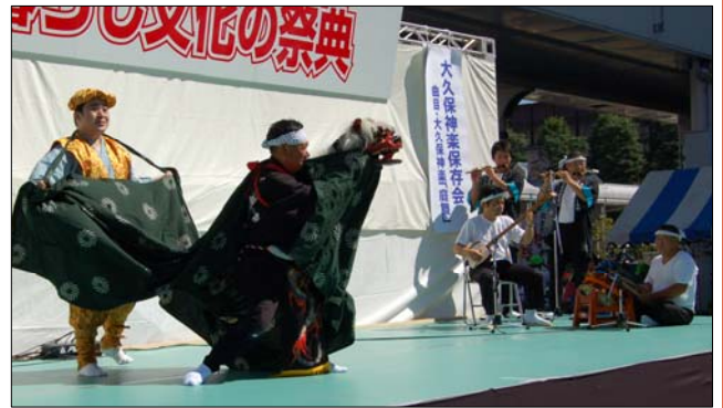
↑山古志の魅力発信！ 厚生会館で越後長岡暮らし文化の祭典が開催されました。野菜や牛串刺しの販売、山古志子ども太鼓会や大久保神楽保存会が出演し山古志地域をPR。(9月20日)