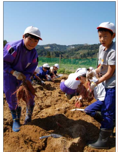
↑大きなサツマイモが取れた～ 震災後、山古志小学校が阪之上小学校とともに生活したことによって始まった2校の交流。久しぶりに再会したこの日は、山の畑でサツマイモ掘り。協力して掘った大っきなサツマイモを手みんな大喜び！(10月3日)