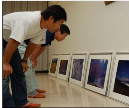
←寄贈いただいた写真の一部は住民のみなさんへ。