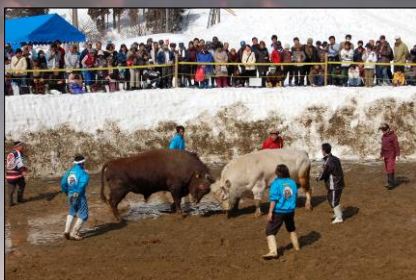
↑雪中闘牛を開催。多くの観衆で賑わいました