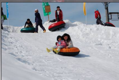
↑スノーチューブのすべり台。子どもたちに大人気です！