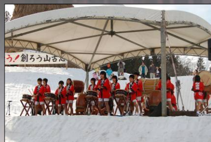
↑ステージでは子ども闘牛太鼓や歌謡ショーが行われました