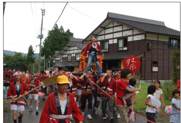
↑平成19年の助成事業：種芋原集落／復興祭！おかえり-種芋原の大地へ(9月8、9日)