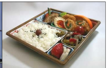
↑金賞を受賞した「菜菜弁当」 ←受賞おめでとうございます！