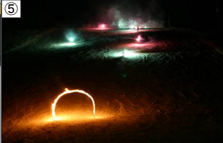
① オープニングのバルーンリリース ② 会場ではその場でついた餅をきな粉と餡子で ③ お楽しみ抽選会。誰に当たるかな～♪ ④ スキーレッスンでスキルアップ！ ⑤ カーニバルも最後。場内の照明を落としたいまつを手に滑走。とても幻想的