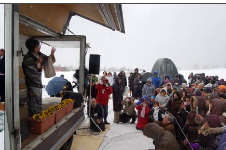
↑ 猛吹雪の中、2トトラックを舞台に熱唱!