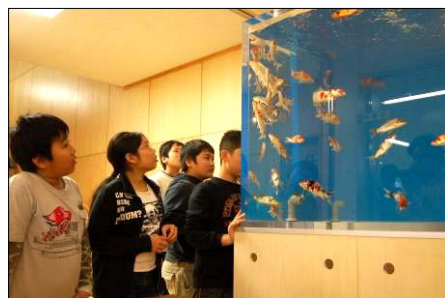
↑ 自分の放った鯉を見守る子供たち

山古志小・中学校で、震災で破損した錦鯉の水槽が復旧。3月5日(月)、虫亀の丸重養鯉場から、小・中学校の生徒・児童数にちなんだ108匹の錦鯉が贈られ、飼育が再開しました。贈られた錦鯉は「一緒に育てて」との願いから10cm程度の当才魚。自分の鯉を一人ずつ選んで水槽に放流しました。小学1年生は、両手を広げて「これくらい大きくしたい」と目を輝かせて話していました。