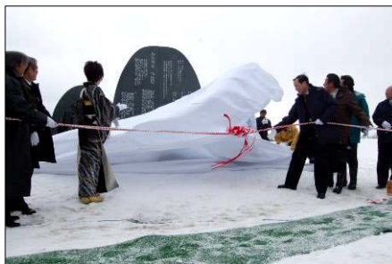
↑ モニュメントは山並みと棚田をイメージ

多くの支援への感謝の気持ちを込めた「感謝の碑」が、国営越後丘陵公園に設置され、その除幕式が3月12日(月)に行われました。当日は歌手の小林幸子さんも駆けつけ、越後絶唱を熱唱しました。