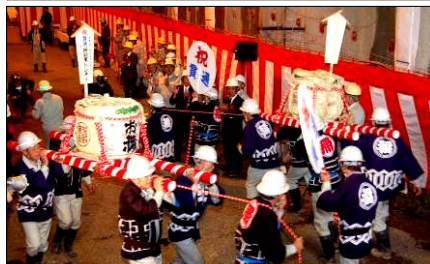
上：最後の発破スイッチ 下：貫通を祝して、みこし担ぎ