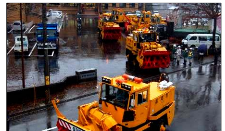
上：道路確保と安全な作業を誓います 下：除雪車のデモンストレーション