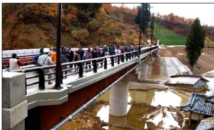
上：完成を記念してテープカット 下：住民による渡り初め