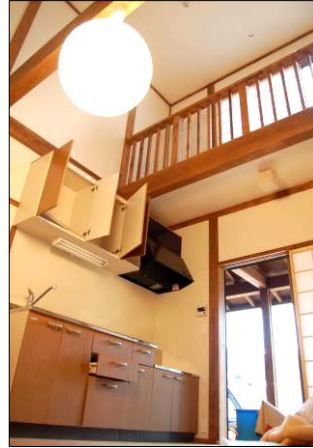
↑竹沢団地3号棟のキッチン吹き抜け