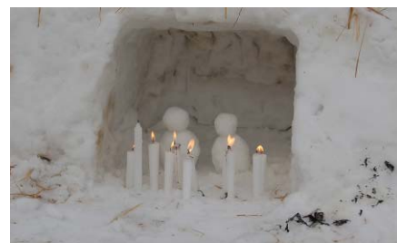
(写真) 虫亀地区の「さいの神」

1月14・15日に山古志の3地区で「さいの神」が行われました。 今年には虫亀地区が山古志で、その他の地区は仮設住宅周辺での開催でした。 みんなで勢いよくあがる炎を囲み、さいの神の火であぶったするめやお餅を食べたり、お神酒を飲んで、山古志の1日も早い復興と地域に戻ることを祈りました。 今年には復興の正念場です！ 健康第一に頑張っていきましょう！！