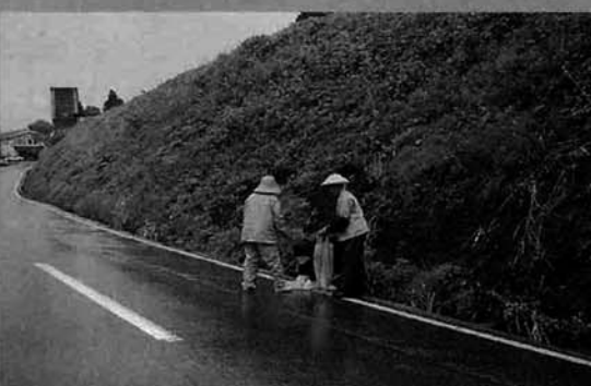
「ゴミのポイ捨て」やめましょう。

五月九日小雨の降りしきる中山古志中学校と老人クラブの合同のクリーン大作戦がおこなわれました。道路わきを中心に集められた空き缶などのゴミは1トントラックと軽トラックいっぱい集められました。おりしもこの日は連続テレビ「こころ」で劇中に初めて山古志村の風景が放映された日、テレビをとおり多くの方が美しい山古志村の風景に関心を持った日に村内をきれいにしたいと参加いただいた山古志中学校と老人クラブの皆さんご苦勞様でした。私たちが手でもうこれからも美しい山古志村を守りましょう。