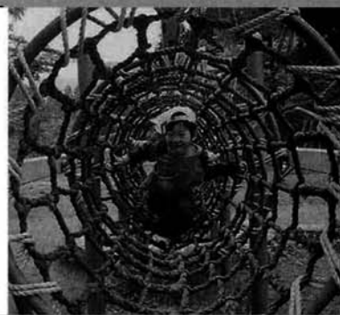
子供は遊びの王様だよ!

五月十六日(金)種芋原保育所と竹沢保育所合同の親子バス遠足が行われ、高柳町のことも自然王国で楽しい一日を過ごしました。