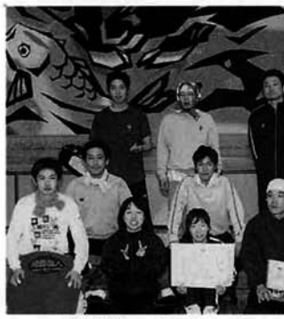
準優勝 ベックンチ