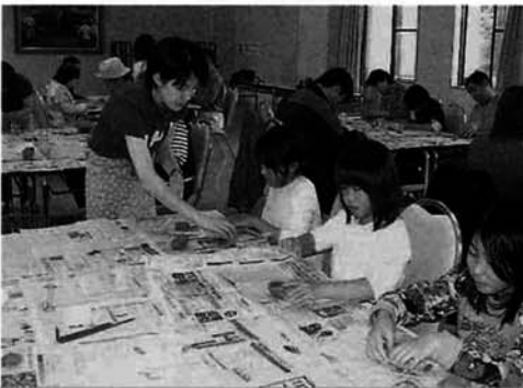
講師を招いて「ぐいのみ」作り(一石会)

初回から参加の方も多く、田植えの準備は万全で去年のことを思い出しながら二反あまりの田んぼに苗を植えました。その夜には昨年自分達で収穫した酒米で造られたお酒に舌鼓を打ちながら盛り上がりました。翌日には「ぐいのみ」作りをし、春の二日間を満喫されました。