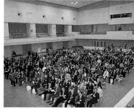
体育館いっぱいの観客 (映写会)

多くの方からのご支援によって生れたこの映画は、山古志村に留まらず全国へそして世界へ発信されて行きます。そしてその存在の偉大さ、当時の男達の家族や地域を思う力強さ、それを支えた女達の辛抱強さは多くの人に感動が伝わっていくことでしょう。