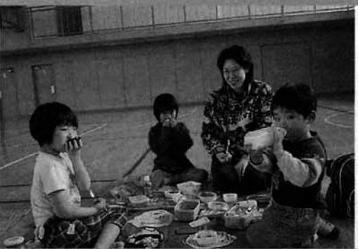
お待ちかねのお弁当タイム

広い園内を元気いっぱい走り回る子供達の様子に参加した保護者も顔をほころばせていました。