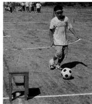
ゴールキーパーを目指して