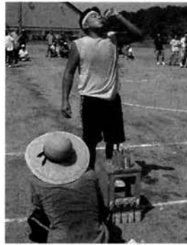
朝一番から大変だねえ