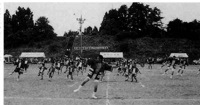
種芋原分館の応援