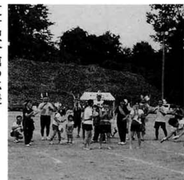
東竹沢分館の応援