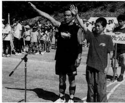
種芋原分館による選手宣誓

当日は非常に暑い中、村内の五つの公民館分館が優勝目指して熱い戦いを繰り広げました。また、各分館による趣向を凝らした華やかな応援合戦もあり、とても楽しい一日を過ごしました。