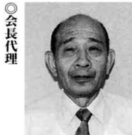
関 勇 梶 金