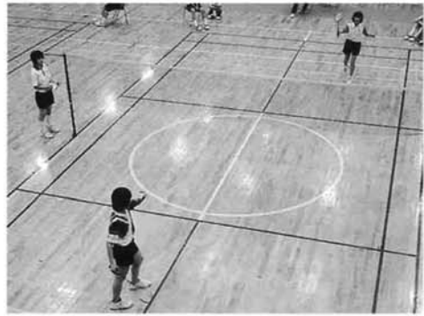
女子バドミントン

梅雨時期の蒸し暑い中、選手 たちは精一杯がんばりました。 負けた試合でも最後まで全力を 尽くしていました。また、応援 していた生徒も、声が枯れるま で声援を送っていました。