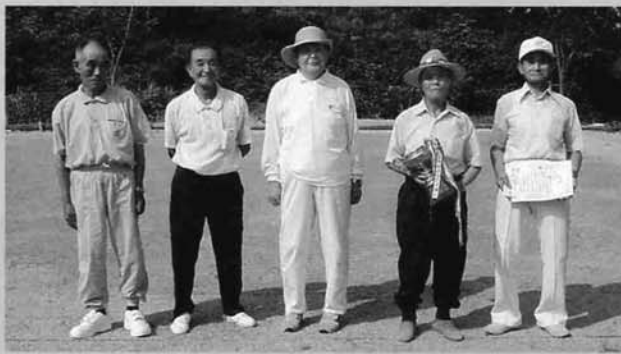
優勝した城山5チーム