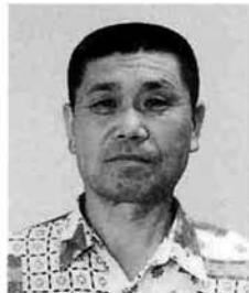
井木 義昭 虫 亀