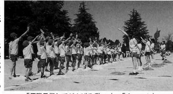
「優勝目指してがんばるぞー。」 「オーッ！」

六月三日(日)に第二回山古志小学校大運動会が開催されました。当日は天候に恵まれ、全校生徒八十五人が赤・白に分かれ、競技に応援に精一杯、がんばりました。