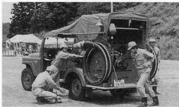
第四分団第四班の自動車ポンプ操法

六月十七日(日)に山古志中学校グラウンドで、平成十三年度、山古志村連合消防一日演習が行われました。 天候が心配されましたが、晴天に恵まれました。 演習では「点検者に敬礼・関・機械器具点検・小型ポンプ操法・自動車ポンプ操法・放水訓練・分列行進」が行われました。