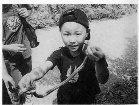
「どお。すごいでしょ。」

六月九日(土)に青空ほうけん塾で萱峠へのハイキングが行われました。種李原のスポーツ広場を出発し、萱峠の牧場まで周辺を散策しながら、歩いていきました。途中で蛇を捕まえたり、牧場では牛と触れ合ったりと、元一杯な子供達でした。