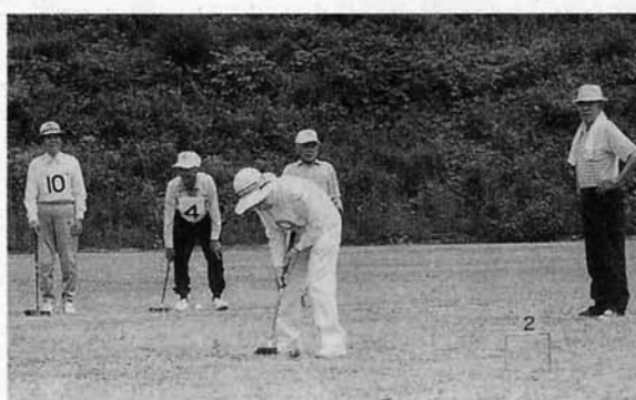
ねらいを定めて、ナイスショット!?

皆さんが日頃、鍛練されている歌や踊りを披露します。また、村に古くから伝わる地唄・天神囃子・田植歌・木遣りなども披露されます。年に一回の晴れ姿をぜひご覧下さい。