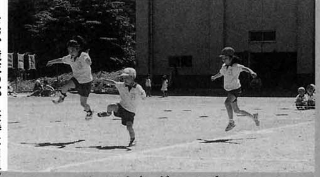
なお、競技の部・優勝は白組 応援の部・優勝は赤組でした。

また、PTAや地区の方々の参加競技があり、児童に負けない？熱戦を繰り広げていました。さらに、新潟大学の留学生の皆さんが飛び入りで参加して、楽しいひとときを過ごしました。