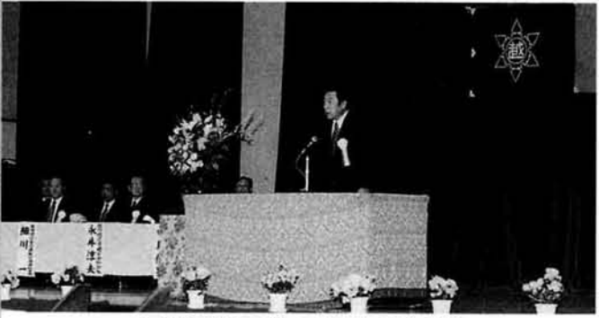
主催者のあいさつをする長島村長

四月四日、長岡厚生会館で長岡地区交通安全条例制定記念大会が行われました。長岡市・越路町・山古志村・長岡警察署が主催で開催され、式典・記念講演・アトラクション・パレードと内容も多く大勢の方が参加してくれました。 式典では、主催者の各市町村長・警察署長の挨拶に続き、市町村議会代表長岡市議会議長・長岡地区交通安全協会副会長・長岡地区安全運転管理者協会会長から祝辞をいただきました。