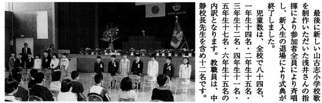
お兄さん・お姉さんよろしくお祈りします