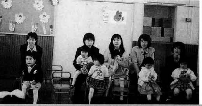
竹沢保育所入所式

四月四日、竹沢保育所・種学原保育所入所式が行われました。入所した園児は、竹沢保育所六人(合計三十三人)・種学原保育所五人(合計十二人)です。お母さん等に連れられて元気に保育所の入所式に出席してくれました。雪が消え、外で太陽の光をいっぱい浴びて遊び回る元気な姿も見られると思います。 将来の山古志村を担う子供達に豊かな自然環境の中で、伸び伸びと育てて欲しいと思います。