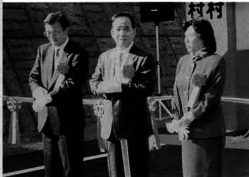
ご多忙のなか出席いただきました

出席いただいた来賓を始め関係者によりトンネルの通り初めのパレードが行われ、山古志村と広神村が完全に結ばれました。この間に、多くの人達の努力があった事を忘れずに、今後も語り継いで皆の宝物であってほしいと思います。