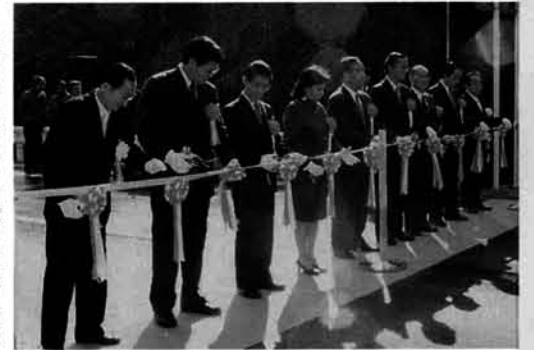
天候に恵まれテープカット

その後、旧中山隧道を歩き安全祈願祭・竣工式会場の広神村水沢新田坑口に行きました。この間の様子と、一連の行事は映像として残され、保存されます。十時三十分から安全祈願祭が行われ終了後に竣工式のテープカット・くす玉わりが、県知事平山征夫様・衆議院議員田中真紀子様のお席をいただき行われました。