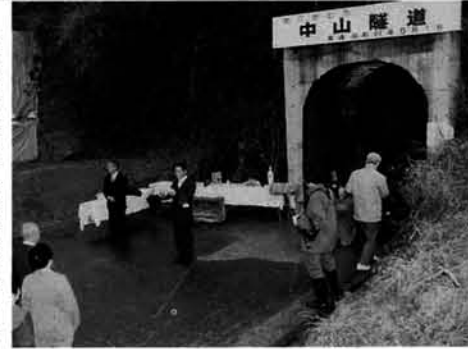
ありがとう中山隧道

十二月十四日(月)安全祈願祭・竣工式・記念式典が行われ、また、各行事に先駆け小松倉集落では、手掘りの旧中山隧道と隧道を掘った先人達に感謝する行事が区民総参加で行われました。