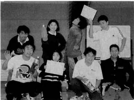
DearBoys&Girlsと寛樹と一緒にの皆さん

第一回山古志村3on3バスケットボール大会が十二月五日(土)村民体育館で行われました。ミニの部は、午後一時三十分から行われ、フリーの部は午後七時から行われました。初めて開催された今大会は、ミニの部で九チーム、フリーの部で八チームの参加を得て大変盛り上がりしました。