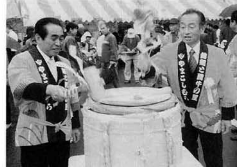
開会式後 村長と関議長により鏡割り