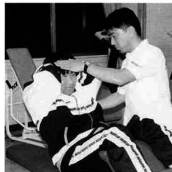
指導者から適切なアドバイス

十一月十六日(月)村民体育館トレーニングルームでトレーニングマシンの使用説明会が行われました。 みんなで、正しい使用方法を学び健康維持・体力増強を図りましょう。