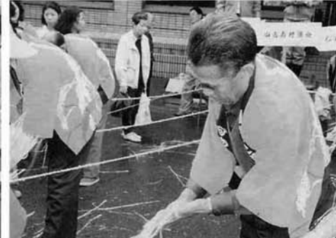
すばらしい技術をみせてくれました