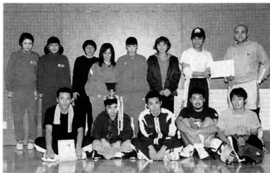
優勝したソーサ71号チーム

七チームの参加で行われ、今大会は総当たり戦による白熱した試合が繰り広げられました。高校生や婦人バレーボール選手・青年など幅広い年代の参加で大会も大変盛り上がり、大会結果は次のとおりです。