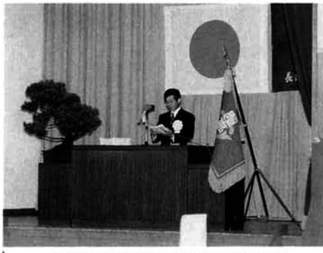
内藤長岡農業高等学校長の式辞

十一月七日(土)長岡農業高校山古志分校体育館で創立五十周年記念式典が行われました。山古志分校は、昭和二十三年六月一日に新潟県立上組農業高等学校種芋原分校として誕生し昭和四十八年に山古志分校と改称されました。 誕生時には、定時制課程農業科修業年限五ヶ年で始まりましたが、昭和四十九年四月に時代の流れとともに全日制山古志分校農業科が設置され五十二年三月には定時制課程が閉校されました。その後昭和六十一年に農業科の募集が停止され現在の普通科へとなりました。