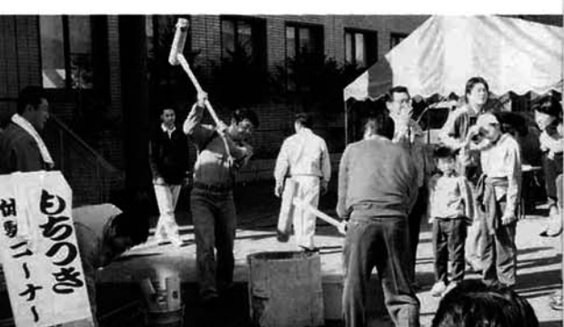
▲もちつきも大人気でした

手打ちそばを堪能 第三回そばまつりが十一月十五日村民会館で行われ、手打ちそばの体験とそば昼食・餅つき体験が行われました。 下村営農集団が中心になって行われたもので、一〇八人が参加しました。参加者は、下村営農集団の方から指導を受けながら、そば粉をこねたり大きな包丁でそばを切ったりゆでたり、慣れない手つきでそば作りに挑戦していました。 お昼には、自分たちで作ったそばに舌鼓を打っていました。