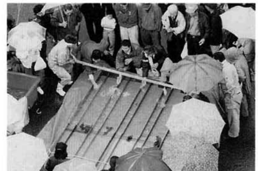
大人気の錦鯉レース

―第二十二回産業まつり― 農産物品評会と特産品の即売を行う産業まつりが十一月三日、役場前を会場に行われ約三千人が来場しました。 品評会には農家が丹精込めて作った米・大豆・白菜等が出品され金賞受賞者には賞状と賞品が贈られました。