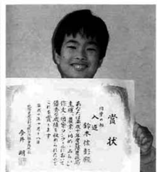
賞状を手に笑顔で