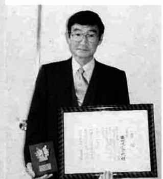
寺塚東竹沢小学校校長

第四十回新潟県よい歯の学校(園)運動が行われ、東竹沢小学校が努力校に選ばれました。 十月二十六日には、長岡市歯科医師会館で表彰式が行われ賞状と楯をいただきました。 日頃から歯を大切にし、歯磨きなど学校全体での取り組みが