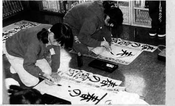
入選めざしてガンバリました!

一月八日池谷小学校で書き初め大会が行われました。冬休みに練習した成果を十分発揮して伸び伸びとした元氣のある字が書かれていました。出来上がった作品は県展に出品されたり校内に展示したりすることでした。児童の元氣さがそのまま字に表れている様子を見るととても嬉しく感じました。