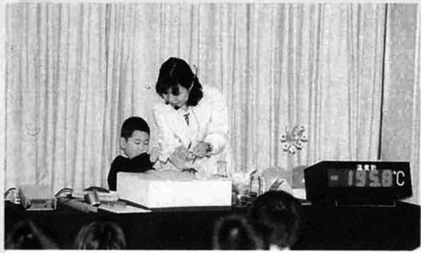
凍った花をにぎってみると...

一月十日(土)村民会館に動く科学館「新潟県立自然科学館」がやってくる」が行われ、いろいろな実験・いろいろな体験ができました。内容としては、①マイナス二〇〇℃の世界(実験の実演)②新潟県に落ちた隕石の話(スライド)③シャボン玉と遊ぼう(体験)になっており参加者は普段出来ない体験をする事が出来たようです。