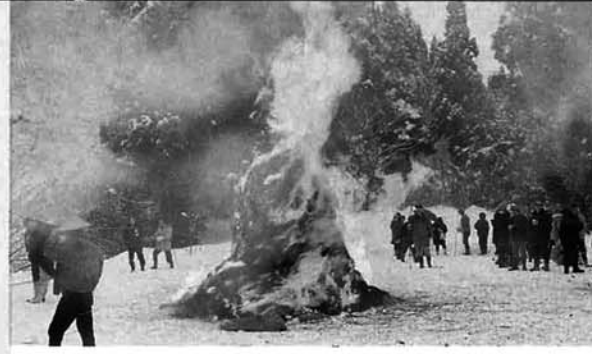
豪快な炎を上げて燃えました

一月十五日、村内各地区で小正月の伝統行事であるさいの神が行われました。竹沢集落では、午前中にさいの神を作り、午後三時に点火がされました。さいの神が煙を上げて燃え上がると、木や竹の小枝に「もち」や「するめ」をぶらさげて焼いていました。昔から、さいの神の火で焼いた餅を食べるとまめになる。煙のいった方は豊作などと言われており、集まった人々は火や煙にあたり無病息災、五穀豊穡を祈っていました。