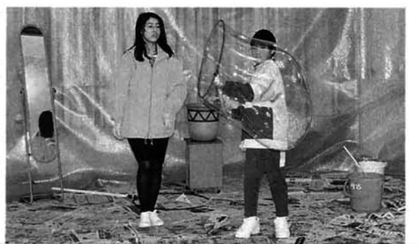
大きなシャボン玉づくりに挑戦

液体窒素を使いマイナス二〇〇℃の世界をつくり、バナナを入れて凍らせて板に釘を打ちつけたり、花を入れて凍らせて手で握り粉々になる体験などマイナス二〇〇℃の世界を実際に目で見たり体験することが出来ました。二番目の隕石の話は、スライドを使いながら実物の隕石を展示し、触ったり切断面のサンプルを見たりする事が出来ました。最後にシャボン玉でいろいろな体験をさせていただきました。新潟県立自然科学館から九名のスタッフが各コーナーの説明や体験指導してくれました。