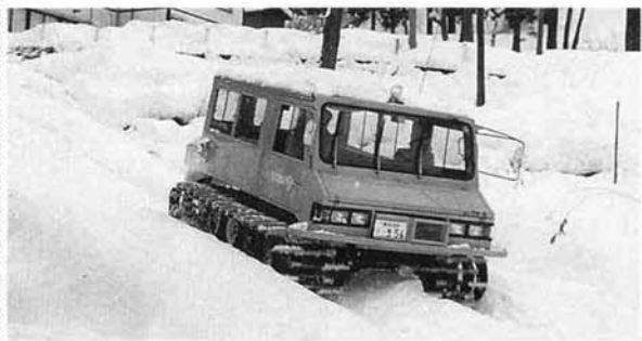
雪上車に乗り庄雪作業中!