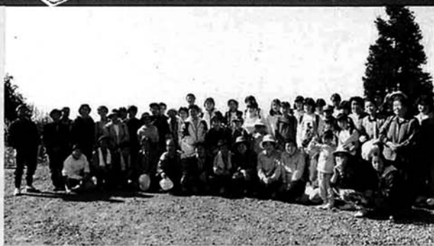
▲金倉山にて ハイチーズ

さわやか健康ハイキングが十一月十六日なごみ苑・金倉山・なごみ苑のコースで行われました。当日は五十四人が参加し、紅葉のきれいな景色を楽しみながら普段の運動不足・ストレスの解消を図ったようです。金倉山での昼食も普段に増しておいしく食べられたことと思います。健康づくりは、歩くことが一番いいことだと聞きます。皆さんも歩くことに心がけ健康な体をつくりましょう。