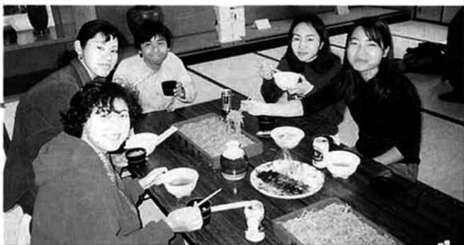
▲おいしいそばに大満足

第二回そばまつりが十一月十六日村民会館で行われ、手打ちそばの体験とそば昼食・餅つき体験が行われました。下村営農集団が中心になって行われたもので、一三〇人が参加しました。参加者は、下村営農集団の方から指導を受けながら、そば粉をこねたり大きな包丁でそばを切ったりゆでたり、慣れない手つきでそば作りに挑戦していました。お昼には、自分たちで作ったそばに舌鼓を打っていました。