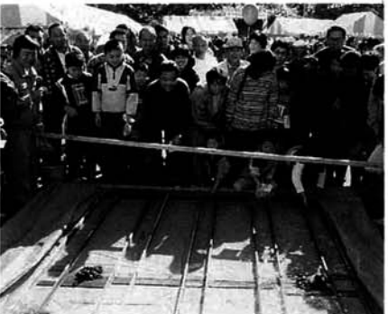
▲新企画錦鯉レース 大盛況でした