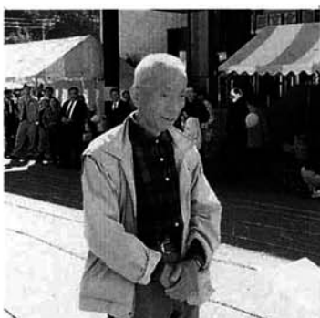
▲みごと優勝の虫亀老人クラブ