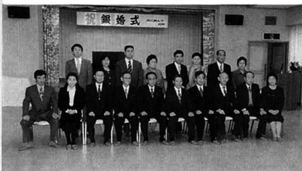
▲記念パーティー参加御夫婦と来賓