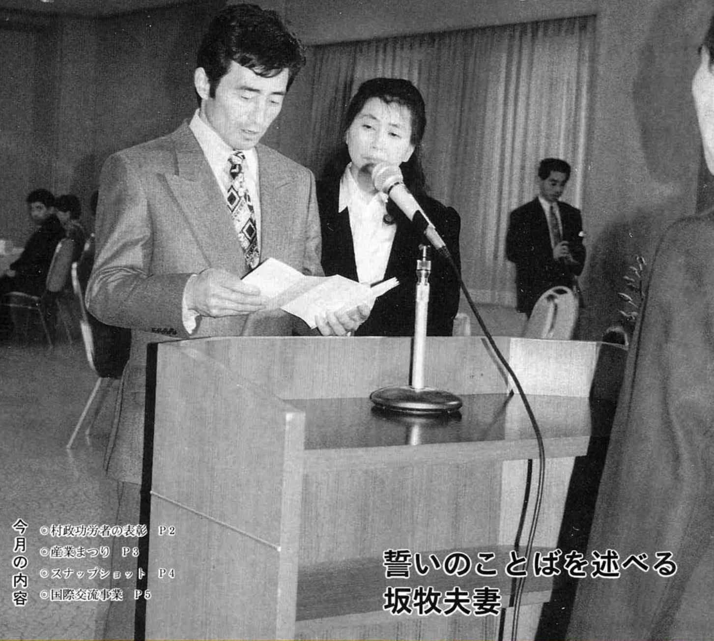
誓いのことばを述べる 坂牧夫妻