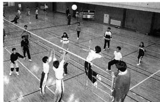
▲レベルの高い試合が繰り広げられました

からの参加者が多く非常にレベルの高い試合を見ることができました。今後もバレーボールを通して広い交流が進められることが期待されます。また、バレーボール教室に参加した人達は、その成果を充分発揮していたようです。なお、大会結果は一月号に掲載します。