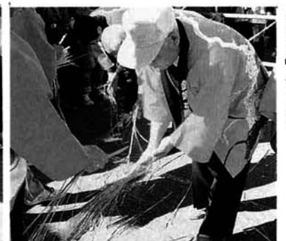
▲すばらしい技術を見せてくれました