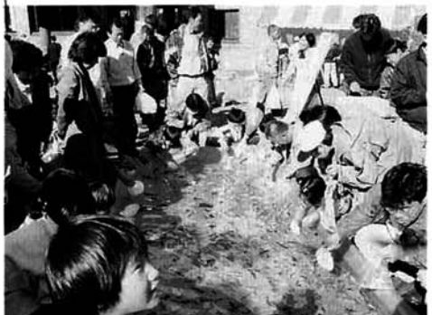
▲大人気の錦鯉すくい