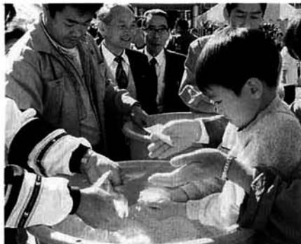
▲山古志米のつかみ取り