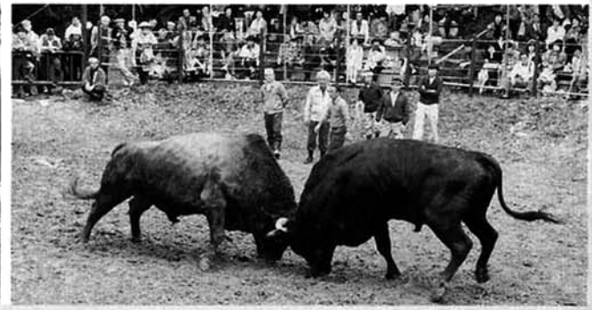
激しい闘牛のぶつかり合い

五月から十一月まで牛の角突きが開催され今年も数多いドラマが展開されることと思います。今年、一体誰の牛が横綱になるのでしょうか。秋まで目が離せません。