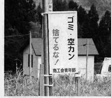
商工会青年部の看板

また、商工会青年部でも、村内の道路脇に立て看板を設置し空き缶・ゴミのポイ捨て防止を呼びかけています。みんなできれいな村づくりを進めましょう。