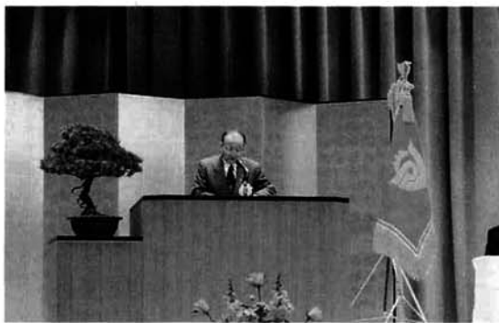
祝辞をいただいた方々