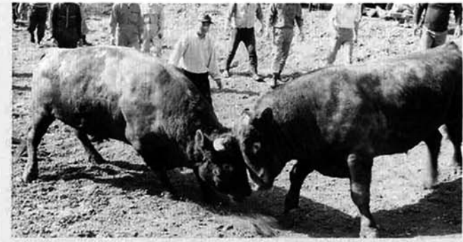
横綱をめざしてガンバレ!