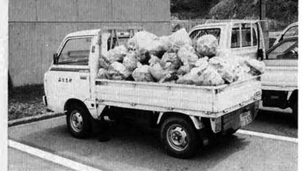
この空缶の山。みんなできれいな村をつくりましょう!

晴天に恵まれた四月二十八日、村内老人クラブ連合会による村内クリーン作戦が行われました。このクリーン作戦は毎年事業活動の一つとして行っているもので、一〇五人の会員が参加しました。各地区から国道道沿いに落ちてくる空き缶を中心に拾いながら役場に向かいます。ビニール袋を片手に手際よく集めると袋はたちまち一杯になり、二時間あまりの作業でゴミの量はトラック二台分(二二〇袋)になりました。