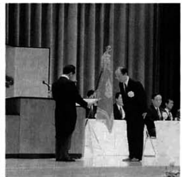
工事関係者へ感謝状贈呈