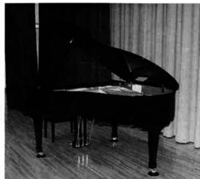
寄贈いただいたピアノ