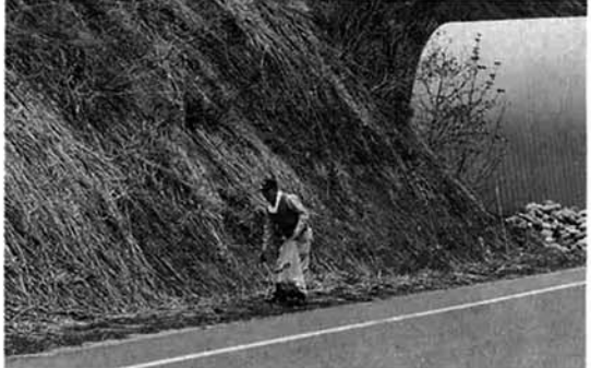
すごい空缶の量です。もっと村をきれいに!