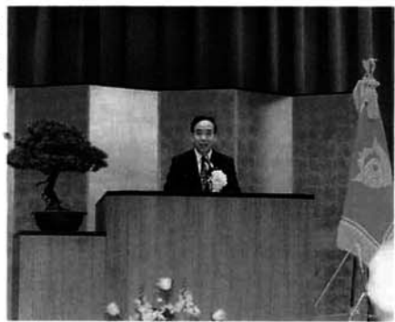
平山県知事より祝辞をいただく

祝辞 山古志村立村四十周年、そして村民体育館・地域福祉センターの竣工記念式典が、大勢の方がお集まりになりました。盛大なお祝いの式典が開かれました。心からお祝い申し上げます。