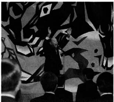
出雲崎町長より万歳三唱