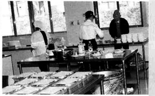
▲「なごみ苑」での弁当づくり