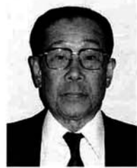
古老人クラブ 古老人 日三 二十五 三月