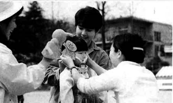
▲お母さんといっしょに楽しいあそび

親子あそびの教室 四月十七日、晴天に恵まれ、長岡市悠久山公園で親子あそびの教室が行われました。総勢二十五人の参加で、楽しく遊んできました。