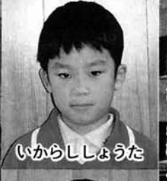
いからししょうた