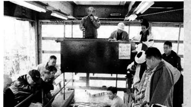
▲番台の声が春を呼ぶ

四月十五日に山古志錦鯉漁協の市場開きが行われました。艶のある丈夫な錦鯉一〇〇舟が出荷され番台の威勢の良い掛け声とともに価格も上がり、原産地山古志村に春を告げました。今後、五月十三日・二十五日に特設市場が予定されています。また、十一月まで毎週火曜日に市場が開催されますので、生産者の多数の出品をお願いします。