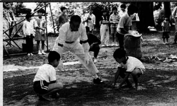
▲未来の横綱目指して・・・チビッコ奉納相撲

種芋原地区では、昨年お神輿を購入、今年は宮太鼓を新しくし祭りを盛り上げようと工夫をしてみました。そのかきもあって祭りは盛会のうちに終わり、子供からお年寄りまで「見て・参加して・楽しむ」祭りとなりました。