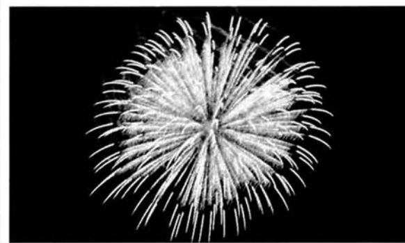
▲夜空いっぱい広がった枝垂れ柳