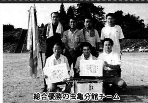
総合優勝の虫亀分館チーム

八月二十日(日)、第二十七回山古志村総合レクリエーション大会が、山古志中学校グラウンドで行われ、虫亀分館が総合優勝しました。 公民館分館五チーム(種芋原・虫亀・池谷・竹沢・東竹沢)による対抗戦で、九種目の団体競技で得点を競い合いました。競技が進みチームの得点が掲示されると、選手や応援団に自然と力が入り、各種目に熱戦が繰り広げられました。