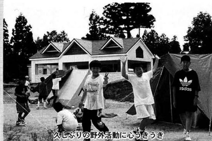
久しぶりの野外活動に心うきうき

「四季の里古志」キャンプ場で青空ぼうけん塾生が、8月1日から1泊2日のキャンプを行いました。野外活動を通して心身の健全な育成を図ることや、村内の自然をもう一度見直そうと計画したもので、塾生28名が参加しました。キャンプ場に着くと日程を確認し、各班ごとに分かれ