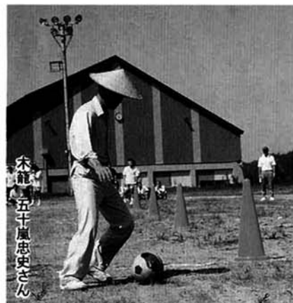
▶Jリーグ顔負けのドリブル?