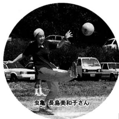
▶ホームランキック!