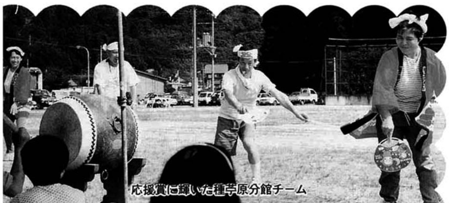
応援賞に輝いた種芋原分館チーム