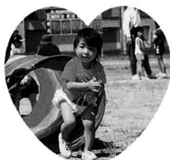
▶オープニングゲームを楽しむ幼児