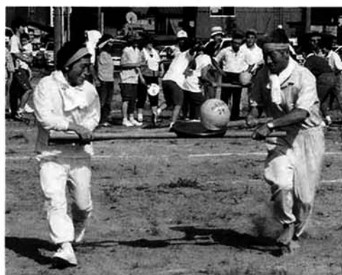
▲心を合わせて東竹沢分館チーム