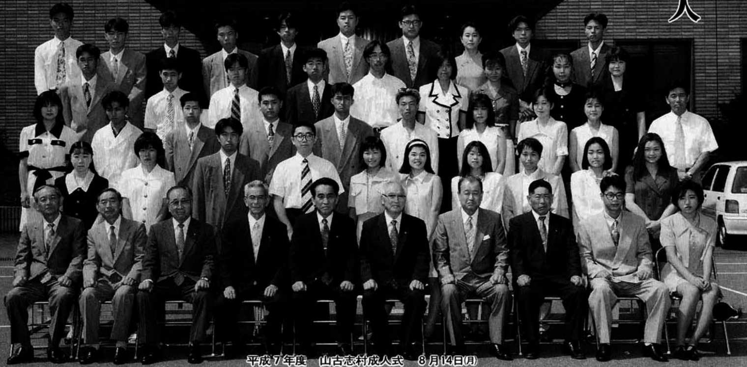
平成7年度 山古志村成人式 8月14日(月)