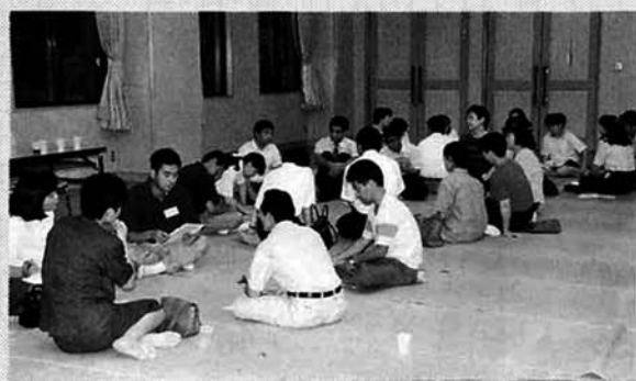
▲各グループに分かれての研究・討議

山古志村PTA連絡協議会主催の村PTA研究大会が八月十日(日)、村民会館で行われました。大会のテーマは「家庭の教育力を高めるには、家庭・地域・学校はどうあればよいか」が設定され、四つの分科会に分かれて活発な研究・討議が行われました。