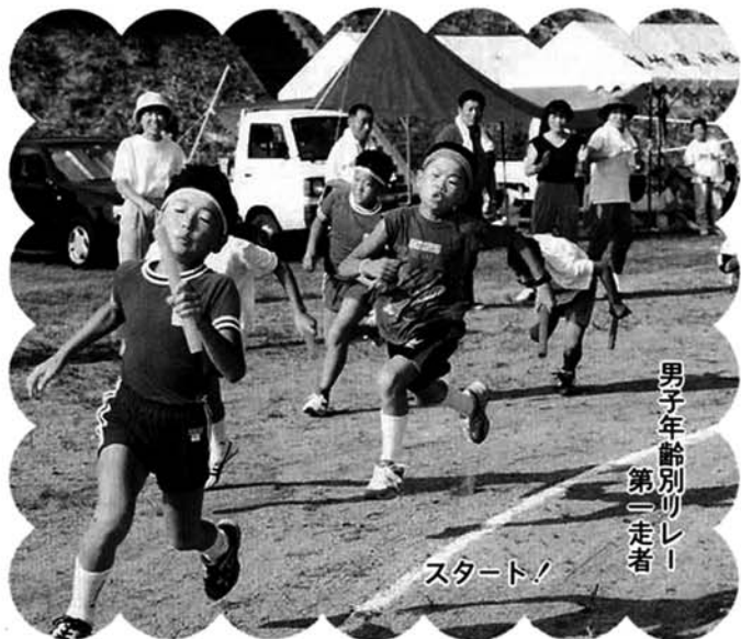
男子年齢別リレー 第二走者