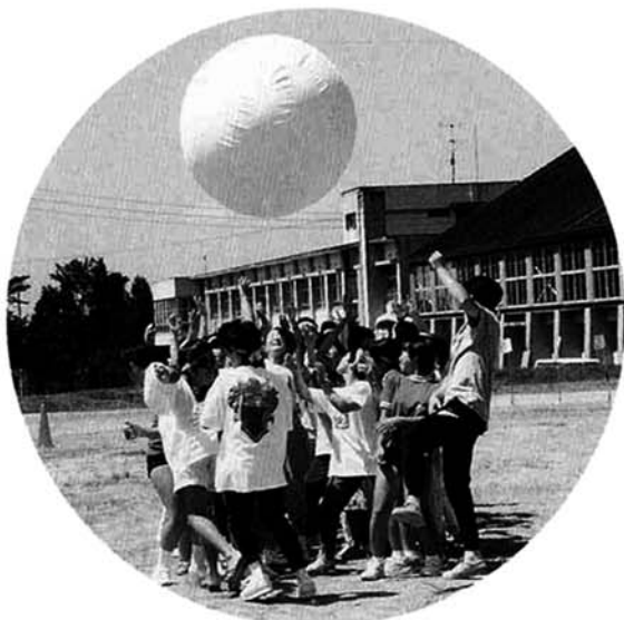
▶大玉送りに汗を流す竹沢分館チーム