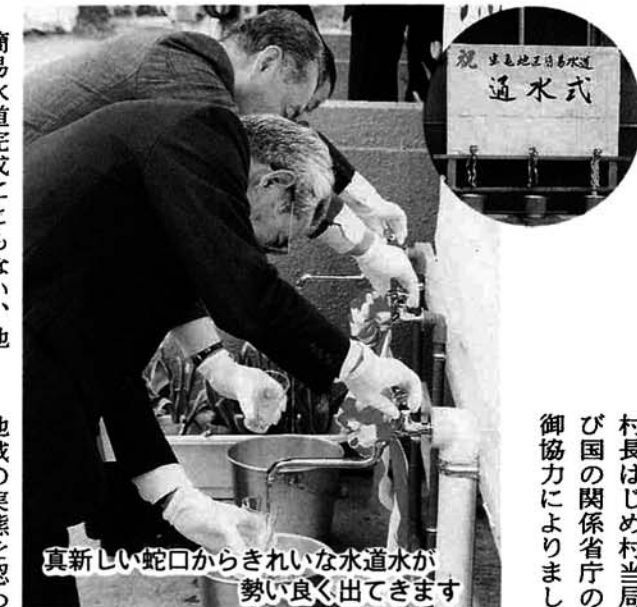
真新しい蛇口からきれいな水道水が勢いよく出てきます

その中、水資源に最も乏しい虫亀地区住民より「松之木沢湧水を虫亀地区の簡易水道にしては」との機運が高まっています。地区民の熱意により、村では平成二年から一年間にわたり自記録計による湧水量調査を行ったところ、良好な結果が得られました。