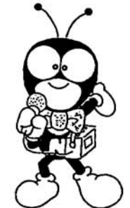
国民年金イメージキャラクター ゆめありくん

国民年金の加入者のうち、第一号被保険者の皆さんは、役場から送られてくる「納付書」などによって、保険料を納めます。しかし、経済的な理由で保険料の納付が困難なときがありま