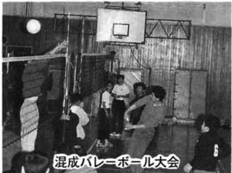
混成バレーボール大会