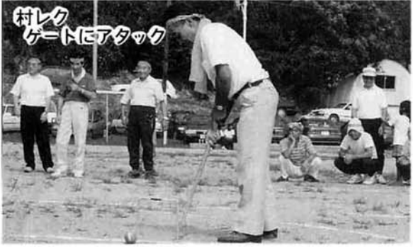
村レク ゲームにアタック

医療については、住民の健康づくりから在宅ケア対策までできる拠点施設の整備と、特定診療科による診療体制の推進を図ります。