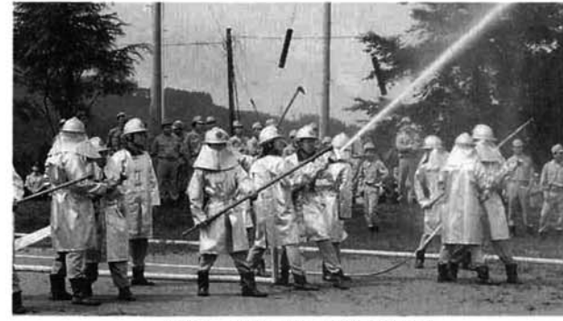
▲本番さながらの放水訓練

消防団員としての自覚と責任を深め、知識及び技術の向上を図り規律厳正な態度を養い併せて地域住民の防火思想の徹底を図り、その使命の完遂を期することを目的として、七月三日、山古志中学校グラウンドで村消防演習が行われました。