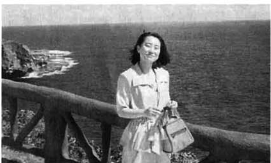
▲パンザイ・クリフにて