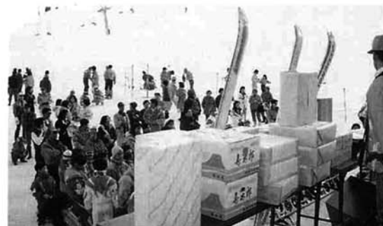
▲盛況だったスキーカーニバル

今シーズンで四年目を迎えた同スキー場は、いわば今年が正念場。数年来の少雪で賑ったシーズンの継続ができるかどうか気にかかるところでしたが、スキーカーニバルで見られたように村内外から多く利用していただきました。最高の入り込み日は、一月十六日と二月二十日で一日約二千人。早朝から駐車場の整理に追われました。当然のごとく、リフトの待ち時間も二〇分と乗り場には長い列が終日続き、食堂もレストハウスも満員でした。両日とも、村外の利用者が多く、長岡市内などからの家族連れが沢山見受けられました。スキー場では、来シーズンに向