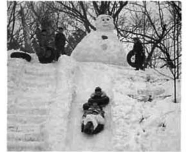
好評の雪上すべり台