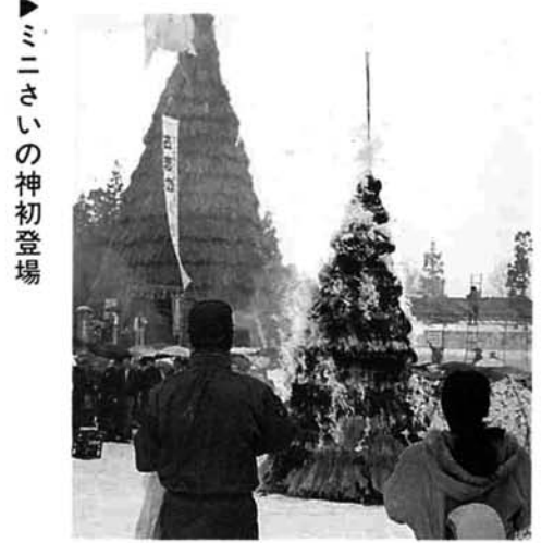
ミニさいの神初登場