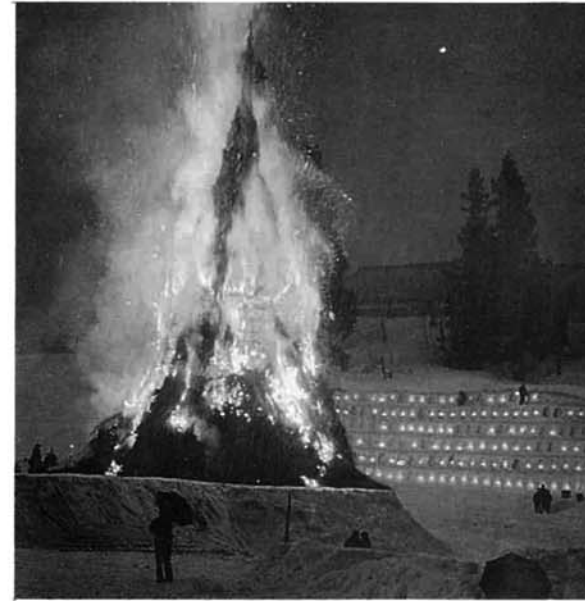
昨年の汚名を挽回 完全燃焼