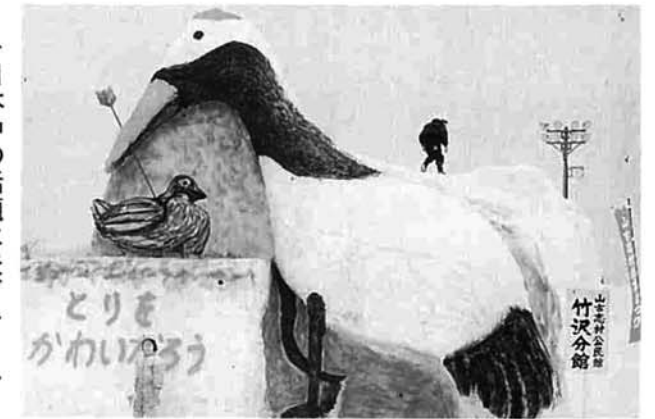
日本中の話題に矢ガモくん 火まつり賞に輝く