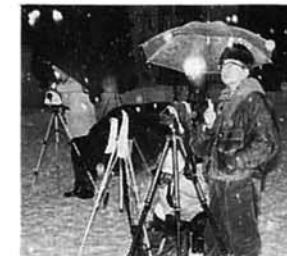
じつとチャンスを待つ