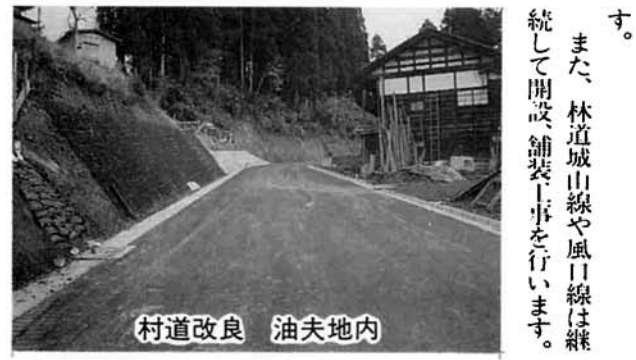
村道改良 油夫地内

国・県道の改良促進については今後も積極的に働きかけを行うことは当然ですが、村道関係においては、改良六線計七〇〇m、舗装六線計、一〇〇〇mをはじめ、維持補修工事費を計上しました。また、除雪能力のアップを図るため、ロータリー除雪車や圧雪車を更新するほか、除雪体制の強化を図るため、引き続き業者委託を行います。前年度、中途から創設した、通勤用車両の駐車場(五百以上)確保に対する助成も引き続き行います。