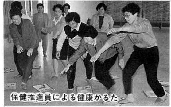
保健推進員による健康かるた

高齢化が進行するなか老人福祉対策をはじめ、地域福祉の核となる社会福祉協議会への業務委託や在宅福祉サービスの向上、ボランティアの育成を図ります。また、新たに老人福祉施設の入所措置権が町村に移譲されたことに伴い措置費を計上しました。精神障害者に対する医療費の助成を新年度から村単独で行います。成人病予防対策も基本健康診査をはじめ、各種検診をさらに充実し、受診率の向上に努めます。老人クラブ補助、高齢者住宅整備資金貸付、ゴミ、し尿処理委託