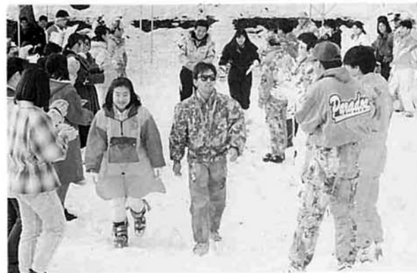
拍手で送りだす。スキーハウスでコーヒータム