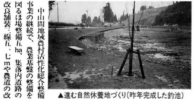
▲進む自然休養地づくり(昨年完成した釣池)

中山間地域農村活性化総合整備事業の継続で、農業基盤の整備を図るほ場整備五ha、集落内道路の改良舗装三線五・七mや農道の改良舗装一線五・七m