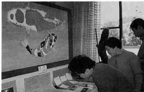
▲ニコニコ会のみなさんの作品

元気いっぱい歌って、まつりを一段と盛り上げてくれました。村民会館では、第八回村民文化展が開かれ、各保育所児童の絵、各小・中学校から選ばれた生徒の絵・習字・焼物などの作品。社会教育講座などで学習している、各教室・クラブ作品(生け花・油絵書道・写真・文化刺しゅう)やニコニコ会が夏から数回に渡り製作した、錦鯉の絵などの多数の力作が展示されていました。来年も大いに期待しています。ふるって出展ください。