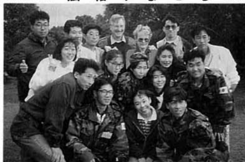
▲グラハム夫婦と研修生のみなさん