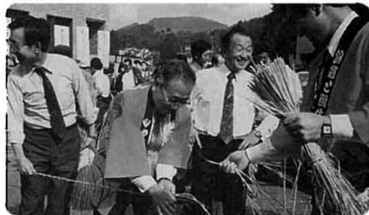
▲善戦もおよばず...村議会チーム

民芸品も実用向きの飾り物が好評のようでした。子供たちは、クジびき、ポン菓子や金魚すくいにと、親を引きづり廻し、なかでも、パンダのエア-アスレチックには、長蛇の列がいつまでも続き大好評でした。まつりの華はなんといいってもバザーコーナー、山菜そば・もつ煮・焼そば・あわモチなどが次々と売れて、山菜そばは昼前に品切れとなったようす。