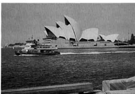
▲海辺に建つオペラハウス

に研修をした。市役所を訪れ、市長を表敬訪問。非常にすばらしい、コミュニケーションサービスマン制度の説明を受け、感銘