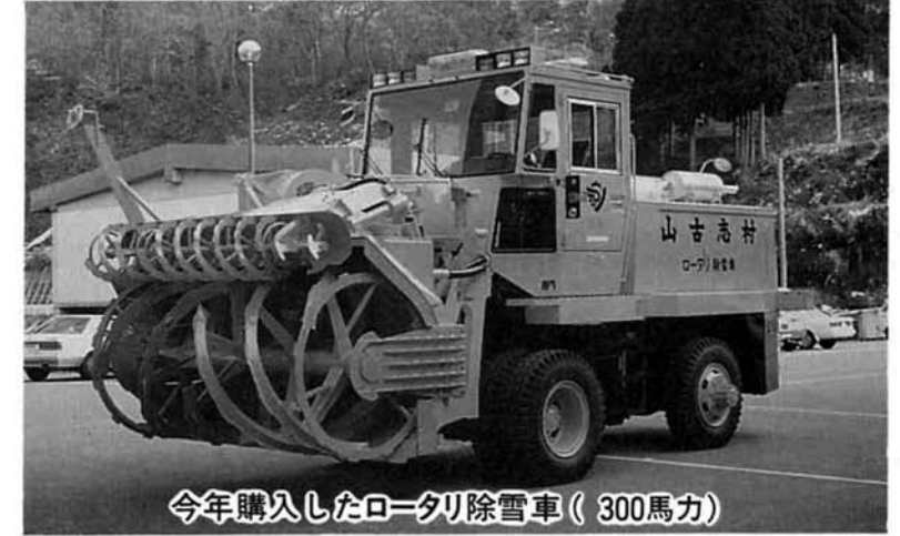
今年購入したロータリ除雪車(300馬力)