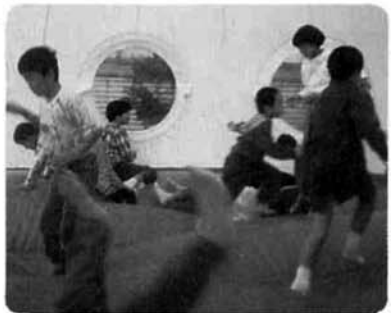
▲パンダエア-アスレチックに長蛇の列