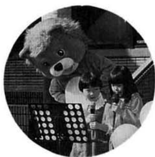
▲好評 チビっこカラオケ