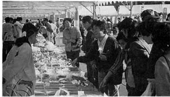
▲人気集中 農産物品評会出品物

開会を前に早くも道路沿えに長い車の列ができていました。九時三十分村長の開会宣言に続きテープカット、そして花火が打上げられ、一斉に風船がはなされて青空高く舞いあがっていききました。たる酒鏡開き後、雄大な闘牛太鼓が鳴り渡るなか、入場者は各物販テント