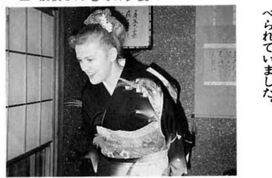
▲ 晴れ着似合いますか