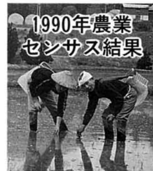
1990年農業センサス結果

昨年二月一日に行われた「一九九〇年農業センサス」の結果がまとまりました。 概要は次のとおりですが、村の農業はどうか変わったのか……数字を見ながら考えてみましょう。