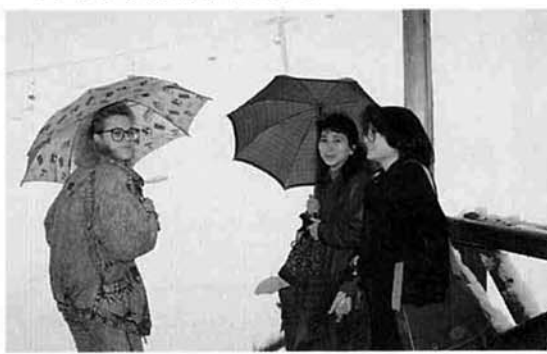
▲ 古志高原スキー場見学