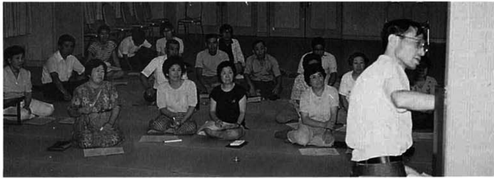
八月七日から十日にかけて、虫亀種芋原竹沢の三会場で、村主催の健康座談会が開かれました。健康への関心が高まっている昨