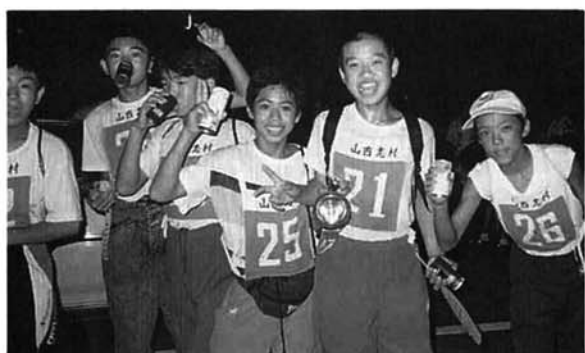
▲余裕の希望チーム(片田の休憩地点)