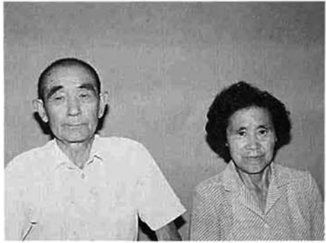
ここまで生きてこれられようとは思いませんでした。と関さん