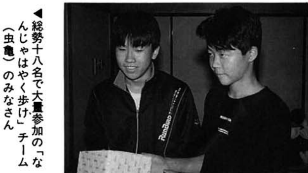
▲総勢十八名で大量参加の「なんじゃはやく歩け」チーム(虫亀)のみなさん