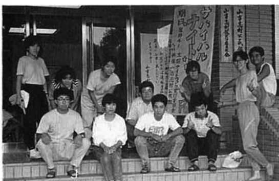
▲主催のサークル「ほうきんとII」のみなさん

参加者は、二十六チーム・八十八人、中学・小学生が大半を占め、最年長者は四十八歳の方でした。当夜は、星空の蒸し暑いなか、号砲の花火を合図に出発し、長距離、長時間の歩け歩けに挑戦しました。東山トンネル付近では、早くもトップと最後のチームは四十