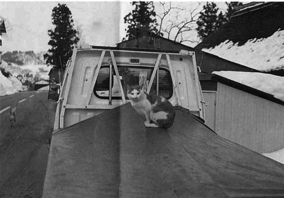
▲猫はこたつで丸くなる……はずなのですが。日なたぼっこをする猫。(2月上旬 池谷で)

「常識の間違い・その2」若者さえ増えれば……と思ひ込んでいる間違い。——だから、自然の摂理として進む社会の人口高齢化現象にこそ問題があるということに気が