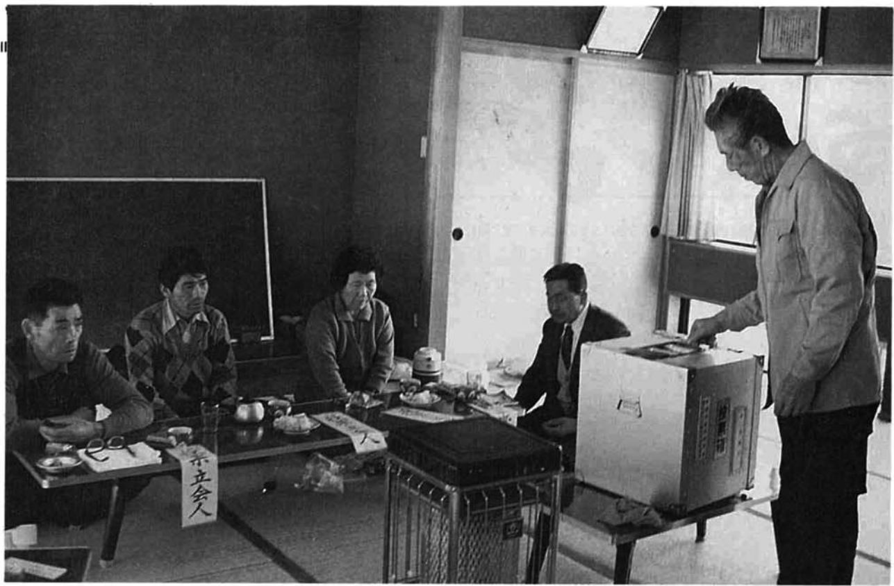
▶第三投票所(池谷)の投票風景(二年二月一日)