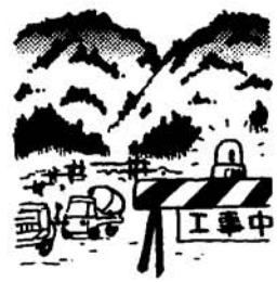
風水害に備えよう

税務所に申込用紙が用意してあります。送り先は、〒一〇二、東京都千代田区九段南一―一 一五 関東信越国税局・人事第二課試験研修係 (☎〇三―二二―三九二一) 約八〇〇人 ＜申込期間＞ 五月一六日〜五月二四日 ＜申込方法＞