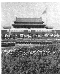
▲北京市内にある天安門

「晩、稀、少」というスローガンがこの国にあります。「遅く結婚して、子供を産む間隔をあけて、数は少なく産む」という意味です。ご存じのように、中国は世界で最も人口の多い国。中国の統計によれば、その数は十億八千万人で、世界中の人々の五人に一人が中国人ということになります。 国土面積は、ソ連、カナダに次いで世界で三番目に広いのですが、人口が東部の平野地帯に集まっているため、過密ぎみの所が少なくないのです。「晩、稀、少」をさらに推し進めるために、一九七九年に夫婦あたり