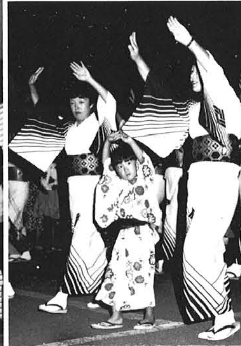
可愛い踊り子さんも登場