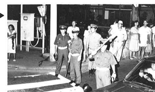
警察・交通指導員も大忙し