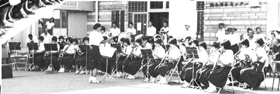
北辰中ブラスバンド演奏