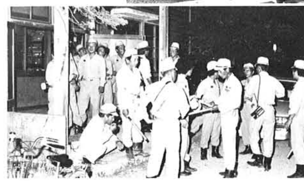
消防団の綿密な打ち合わせ

老若男女が勢揃い! 八月十六(木)・十七日(金)の二日間、第三回わしままつりが盛大に開催されました。 十六日は前夜祭として、島崎に古くから伝わる「弓踊り」と大花火大会が行われ、沿道にはお盆の帰省客を含めたたくさんの観客でいっぱいになりました。 また、十七日は小学生の鼓笛パレードや中学生によるブラスバンド演奏、夜には祭りのメインに定着したカラオケ大会(BSNカラオケ大会予選)が行われ、会場の体育館に入りきれない程の聴衆が集い、盛会のうちに終了いたしました。