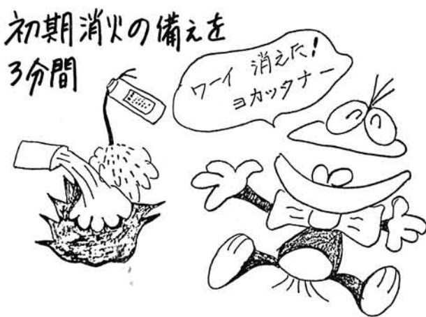
初期消火の備えを3分間

火災のようすは燃える物、場所により異なりますが、一般住宅の場合、天井に炎が達するまで三分～五分位かかります。この三分間が大切な初期消火の時間です。煙や炎にまどわされず、あわてずに、落ちついて行動しましょう。