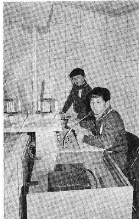
↑ 昼休みの楽しい時間、でも放送係は大変です。(スタジオにて)