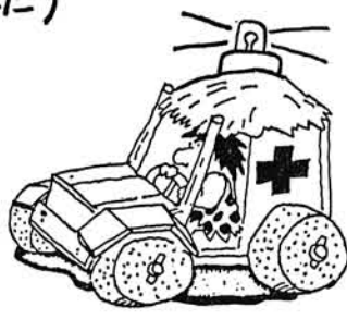
(大古の昔から血液は大切でした)

血液が非常に大切なものであるという事は、大古の昔から、現代未来にいたるまで何ら変わる事のない真実です。輸血が人命救済のかけがえのない手だてとして、着実な進歩と、これに呼応するように献血が社会に広がって来たのです。しかし最近の交通事故の多発、輸血用血液の需要が増大しております。あらためて献血の意味を原点から考え直す必要があります。人間は血液なくして生きて生きられませんが、人工的に作ることも出来ません。他人の為と考えず、自分や家族の万一の為にも年一回以上の献血をお願いします。五十二年度の和島村割当本数にまだ百本以上不足しています。皆さんのご協力をお願いします。