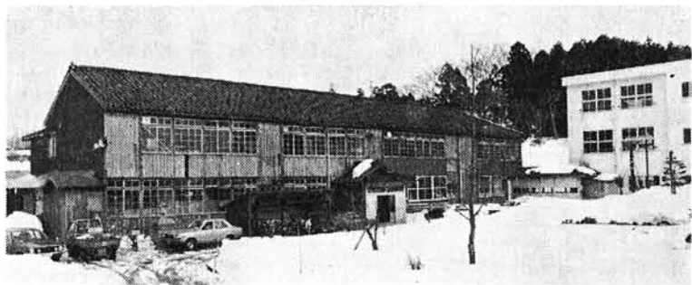
改築予定の桐島小学校

次に農村教養文化体育施設に村費七千七百万円を付け足して名実共に総合体育館としての機能を発揮させることとし、その財源として、財政調整基金から二千七百万円を取りくずし、土地開発基金から五千万円を運用借入することとします。 この結果一般会計予算の規模は八億三千五百五十万円となり、前年度当初予算に比べ額にして二億八千六百四十六万円の増であり、