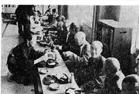
【写真・おじいさん、まあーツッペー飲みませー】

き上げは、四年～五年ごとに行われてきていましたが、今回の改正では、その間でも消費者物価の変動によつて年金を受けている人の生活を支える年金額が減価することのないよう、自動的なくみとしてスライド制が設けられることになりました。