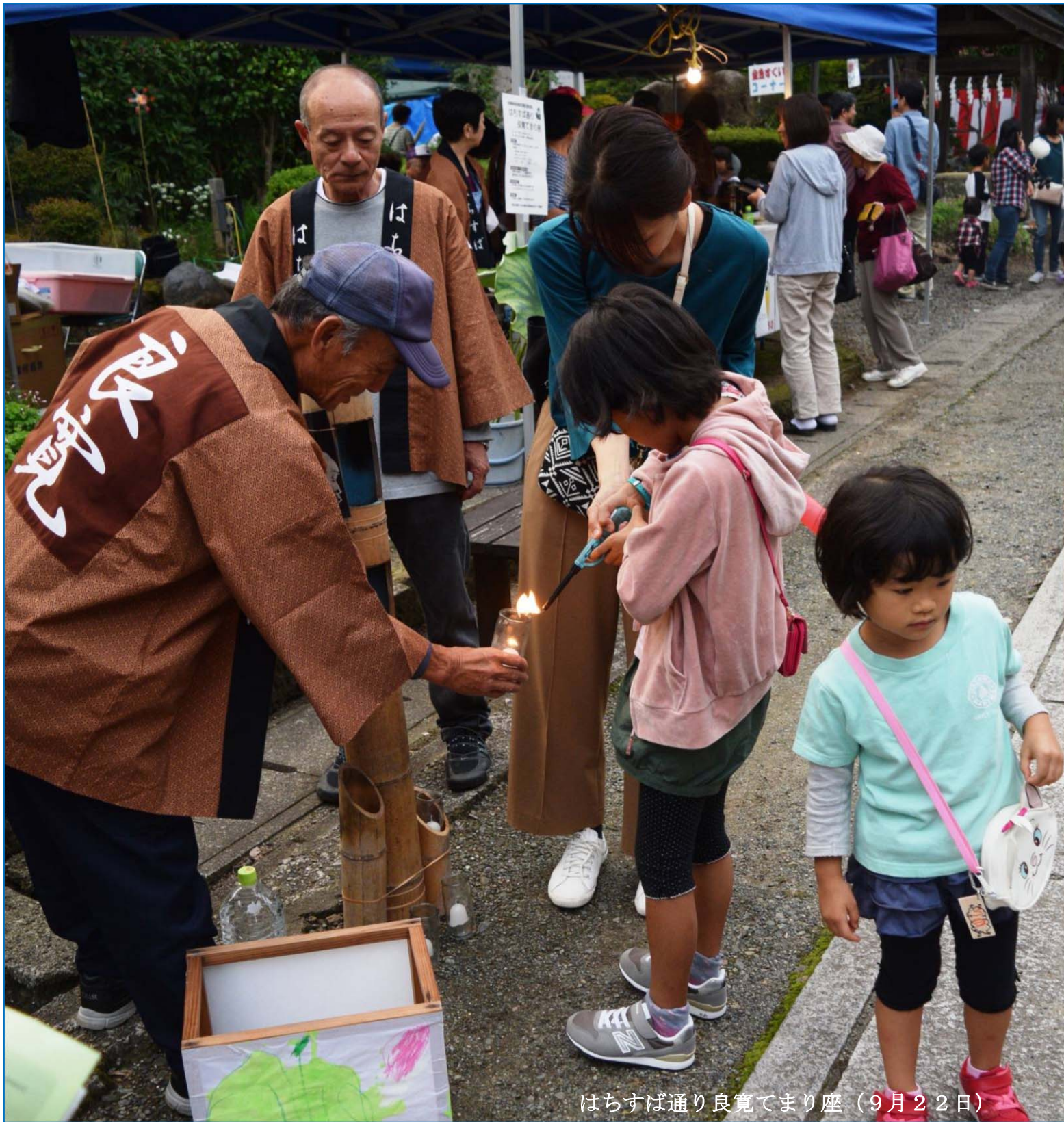
はちすば通り良寛でまり座 (9月22日)