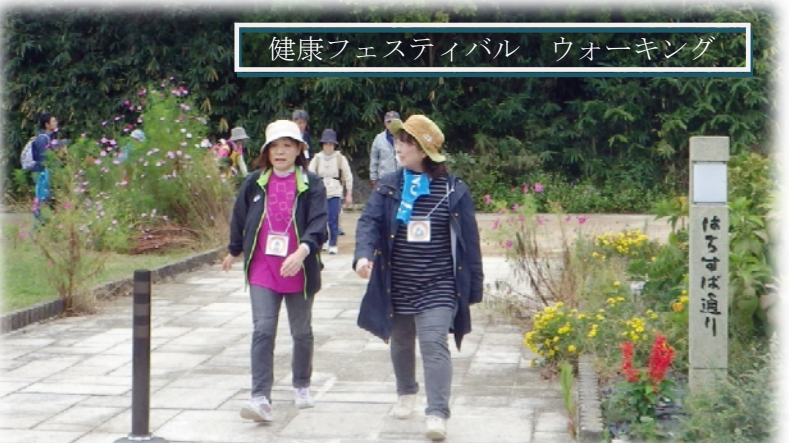
健康フェスティバル ウォーキング