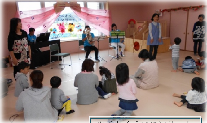
わくわくミニコンサート