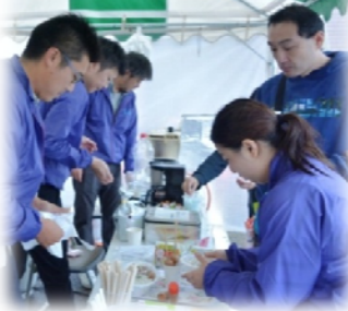
だんご祭り飲食ブース