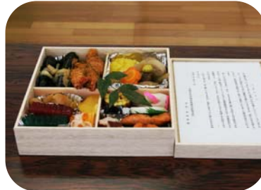
▲皆さんの善意で完成しました！