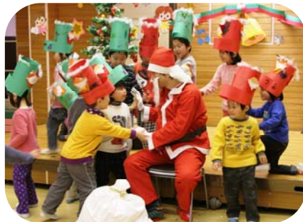
▲サンタさん、来年もまた来てね！