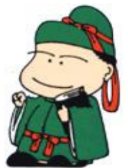
和島地域生涯学習キャラクター ならんわし麻呂くん